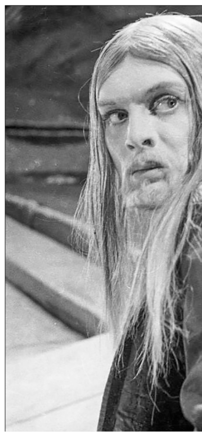
□ Монах Евстафий в фильме «Иван Грозный» (1945).

Напомним: это тот самый Эйзенштейн, которому Чарльз Спенсер Чаплин (больше известный как легенда мирового кино, актёр и режиссёр Чарли Чаплин) подарил свой портрет с надписью: «Моему другу и учителю. Признательный Чаплин».