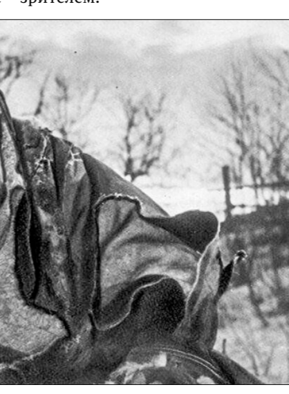
□ Мересьев в «Повести о настоящем человеке» (1948).

После тех съёмок между Черкасовым и Кадочниковым установились крепчайшие дружеские, почти родственные отношения. Когда во времена «хрущёвской оттепели» Павла Петровича вдруг перестали снимать, Черкасов заставил своих администраторов в обязательном порядке включать Кадочникова участником своих творческих вечеров — без него он отказывался выступать. А после концерта большая часть тонора передавалась Павлу Кадочникову. На даче Кадочниковых Черкасов собственноручно посадил яблоно, которая ус-