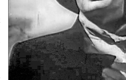
□ В роли Максима Горького в фильме «Яков Свердлов». 1940.

— Не надо, — ответил я. И тогда вдруг услышал: «Кругом!» Я повернулся по-военному чётко и зашагал к выходу... Война оставила глубокий шрам на судьбе Павла Петровича. «Антон Иванович сердится» — последний