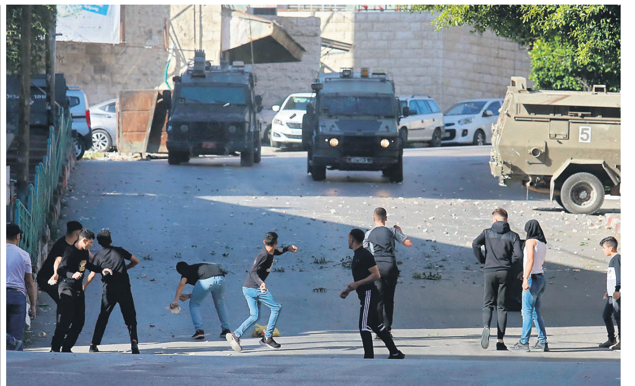
Израильская операция по устранению террористов в палестинском городе Наблус на Западном берегу реки Иордан спровоцировала новые столкновения

Сразу после появления новостей о ликвидации террористов в Наблусе пришло сообщение о новом теракте. С начала года в результате терактов погибли 18 человек — израильтяне и иностранные граждане. Одновременно Минздрав Па-