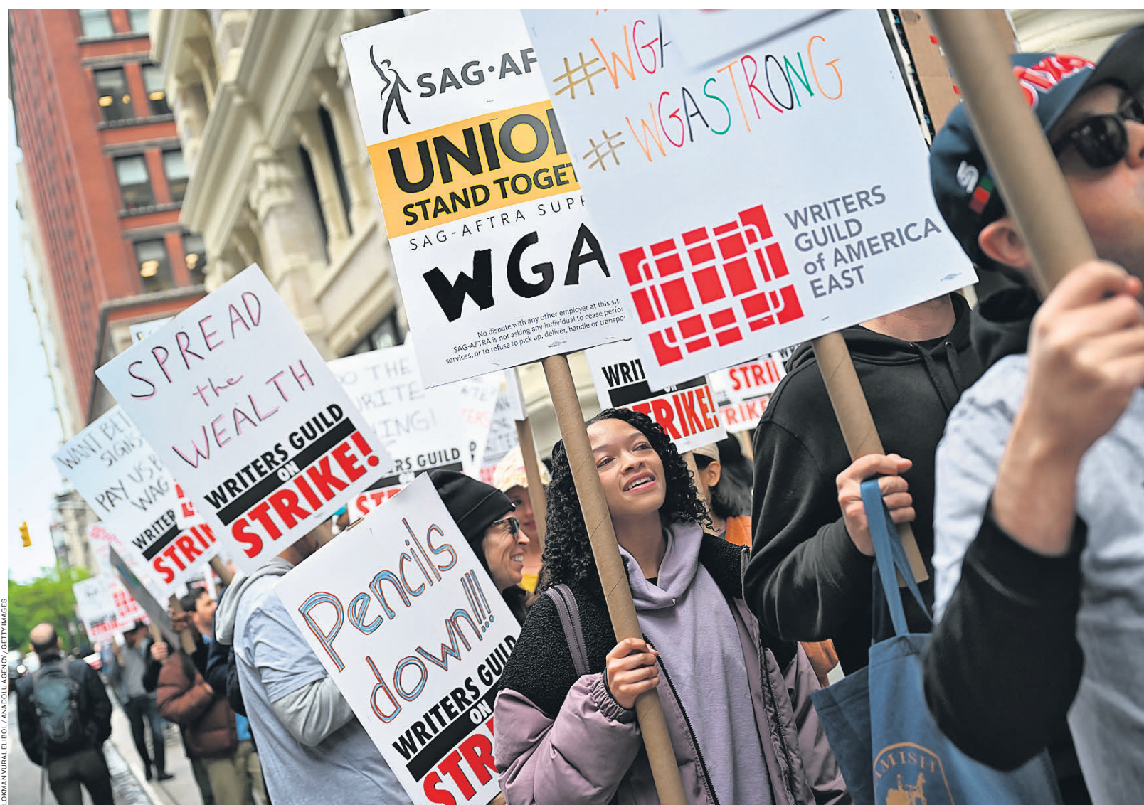
На улицы американских городов сценаристы вышли, чтобы не оказаться на улице

Основным триггером трений между WGA и AMPTP послужили перемены, которые произошли в индустрии из-за «революции стримингов», изменившей зрительские привычки и саму бизнес-модель современного телевидения. Если раньше стандартный сериальный сезон состоял из 22–24 эпизодов и сценаристы занимали работать над ним на восемь-девять месяцев, причем эта работа продолжалась, когда первые серии уже снимались и даже выходили в эфир, то теперь сезоны сократились до шести-десяти эпизодов, и все они должны быть написаны за 10–13 недель до того, как производство шоу будет запущено. Вместе с сокращением сроков работы падают и зарплаты.