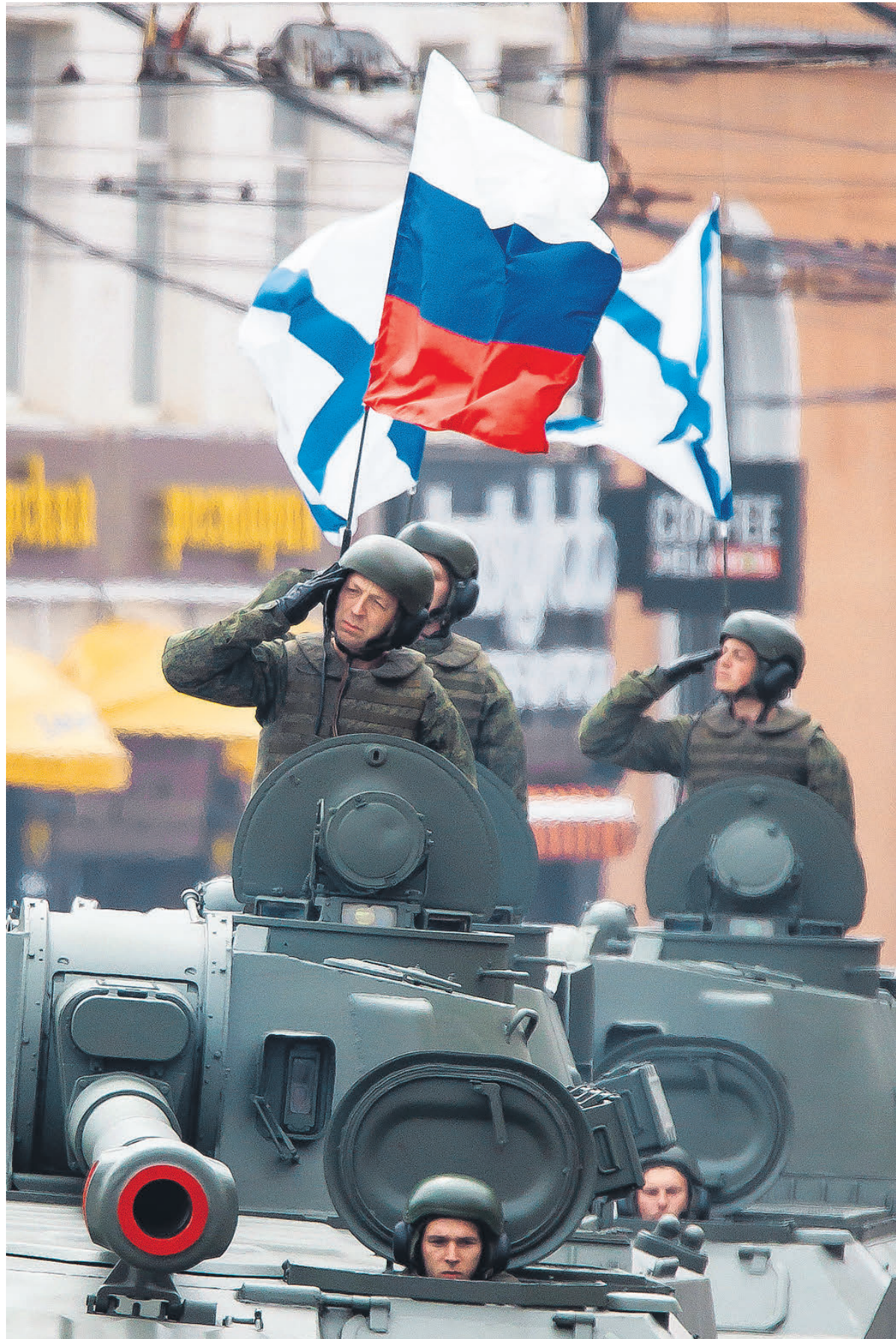
Об отмене традиционных военных парадов по случаю Дня Победы из соображений безопасности объявили власти уже полутора десятка регионов России